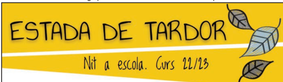
Cartell de l'Estada de Tardor a l'Escola.

L'estada començarà el pròxim dijous, dia 3 de novembre, i acabarà el divendres, dia 4 de novembre, a migdia, moment en el qual aprofitarem per a acomiadar-nos dels nostres Grups de Convivència fins al pròxim curs.