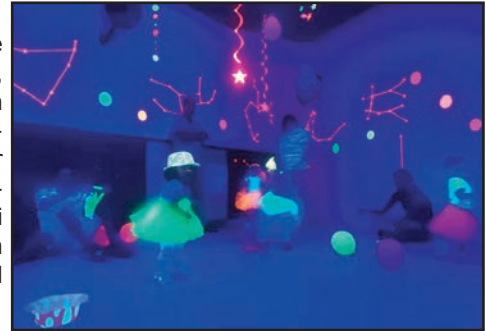
Quatre fotografies de la jornada vespertina.

Passat divendres, les famílies de les classes d'1, 2 i 3 anys (Marietes, Caragols, Inuits i Apatxes), van poder gaudir d'una jornada vespertina que l'equip d'Infantil va preparar amb molta estima. Un moment d'unió on van poder berenar juntes i compartir joc, converses i rialles en unes activitats distribuïdes pel primer cicle i el pati d'infantil.