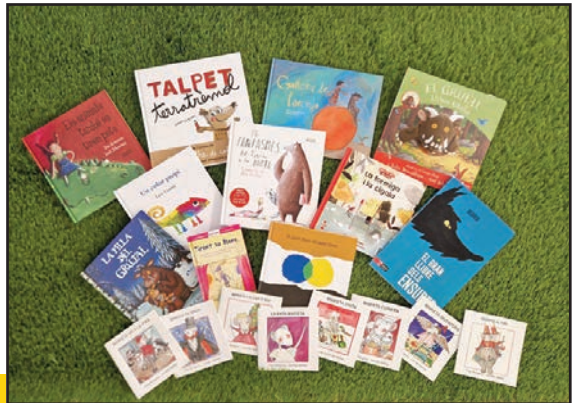
Comanda de llibres a Infantil.

Infantil ha fet una comanda de contes, alguns que calia renovar i altres adquisicions noves, encara ens falten per arribar, però els xiquets i les xiquetes ja poden gaudir de les noves aventures a la nostra biblioteca d'Infantil, fins i tot dur-se'ls a casa mitjançant el préstec setmanal.