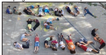
L'alumnat de 4t B inicia el seu Projecte.

Finalment, la classe de 4t B de Primària acaba d'encetar el seu projecte després d'haver escollit entre dos grans temes: la ciberseguretat i la Llengua de signes. Les votacions, encara que molt ajustades, acabaren decantant-se per aprendre sobre el món dels sords. Així doncs, ja han començat a preguntar-se infinitat de qüestions al voltant d'aquest apassionant tema. A més a més, alguns alumnes ja han anat investigant motu propi i han dut l'alfabetari dactilològic per a saber representar els seus noms. Per a finalitzar el seu projecte, volen acabar fent subtítols i algun curmetratge adaptat per a sords.