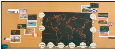
Full de ruta del Projecte de 3r A de Primària.

A la classe de 3r A, l'alumnat ha triat per votació "Els misteris de món". A través d'una gimcana per tot el pati de Primària, van arribar a endevinar els 6 misteris que treballaran al llarg d'aquest projecte: Llac Ness, Stonehenge, Piràmides de Gizeh, Línies de Nazca, Illa de Pasqua i el Triangle de les Bermudes.