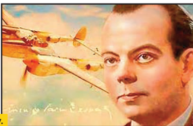
Antoine de Saint-Exupéry.

Antoine Marie Jean-Baptiste Roger de Saint-Exupéry (França, 1900 - Desaparegut en accident d'aviació al sud de França durant la guerra, 1944), fou un escriptor, poeta i aviador francès. Com a periodista va realitzar grans reportatges al Vietnam, a Moscou i a Espanya. Va escriure El Petit Príncep a Nova York durant la Segona Guerra Mundial. L'obra es va convertir en un èxit mundial.