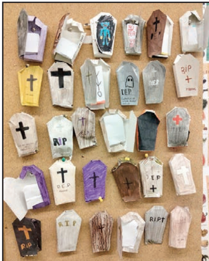
Cementiri vertical amb els taüts i un exemple d'un text.

Professora del departament de Llengües d'ESO.