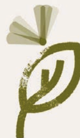
Logotip de l'empresa ELYTRA.