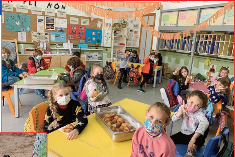
L'alumnat de 1r B de Primària ha pogut tastar les delícies gastronòmiques elaborades per l'alumnat de 3r d'ESO de Francès.

D'aquesta manera, l'alumnat ha pogut viatjar a París, visitar alguns llocs importants, ballar cançons típiques, practicar