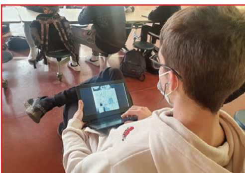
Quatre imatges de lectores i lectors en diferents punts de l'Escola, celebrant el Dia del Llibre.