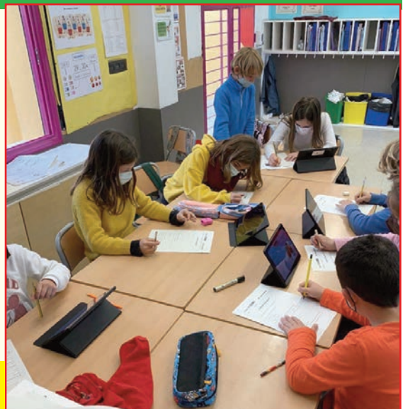
Alumnat de Tercer de Primària preparant el Projecte sobre «El Cos Humà».

tàctils i continuarem amb exposicions, murals i conferències, acabant amb l'elaboració d'una col·lecció de jocs de taula sobre aquest apassionant tema.