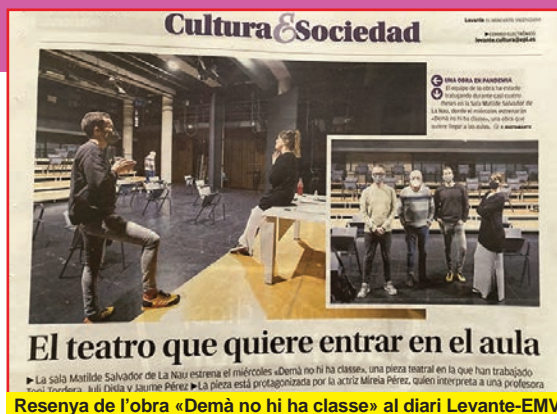
Resenya de l'obra «Demà no hi ha classe» al diari Levante-EMV.