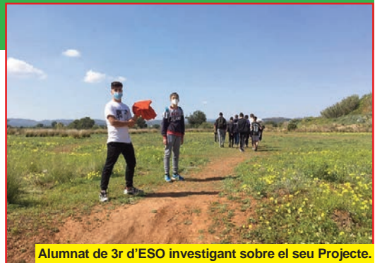
Alumnat de 3r d'ESO investigant sobre el seu Projecte.

Es treballarà la flora, la fauna, el relleu i la geologia i l'orientació pel barranc i, en acabar, oferirem a l'Ajuntament de Picassent el resultat per a fer-lo visible al veïnat de la Urbanització en la que ens trobem.