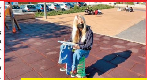
Alumnat de 1rB d'ESO al Parc front a l'Escola.