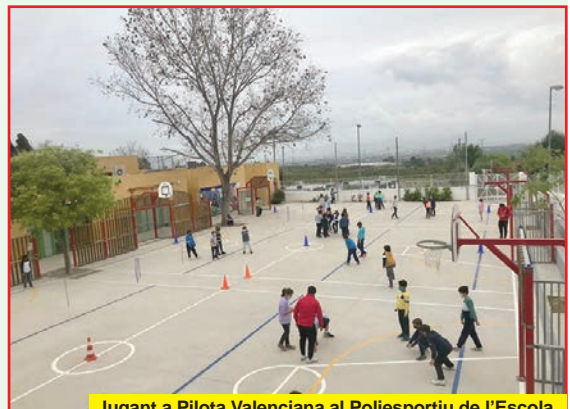
Jugant a Pilota Valenciana al Polidesportiu de l'Escola.