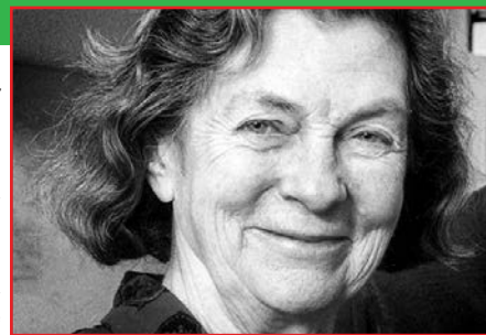
Anne McLaren, biòloga.

26 de abril de 1927, va néixer la biòloga Anne McLaren . Va ser pionera en l'estudi de la biologia del desenvolupament. El seu treball va ajudar a desenvolupar la tècnica de fertilització in vitro.