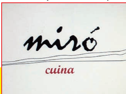
Logotip del restaurant MIRÓ CUINA de Benirrama (Marina Alta).