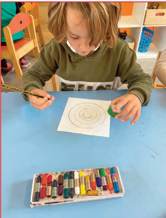
Quatre fotografies dels Projectes realitzats a Infantil 4 i 5 Anys.