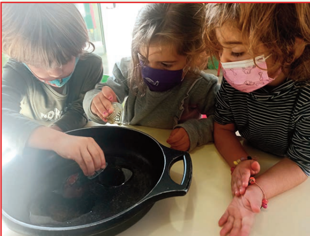
Alumnat d'Infantil 4 i 5 Anys amb el Projecte de la Volta al Món.