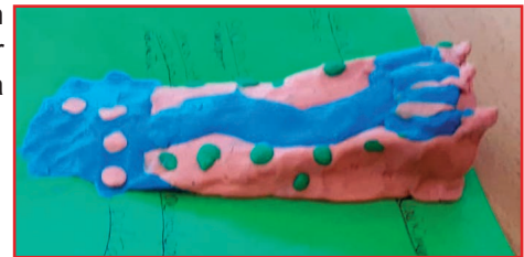
Maquetes dels cursos dels rius realitzades per l'alumnat de 1r d'ESO.

L'alumnat de 1r d'ESO, dins l'Àmbit Lingüístic-Humanístic, ha estat estudiant el relleu, els continents i l'aigua. Us mostrem una de les activitats per poder visualitzar millor els conceptes, consistent en la elaboració de maquetes en les què han pogut plasmar els cursos dels rius: alt, mitjà i baix.