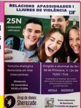
Cartell anunciador del 25N

Aquesta és una de les activitats programades a l'efecte, però hi ha més. Us informarem de com ha sigut el Dia, al proper número del Correu del Dijous.