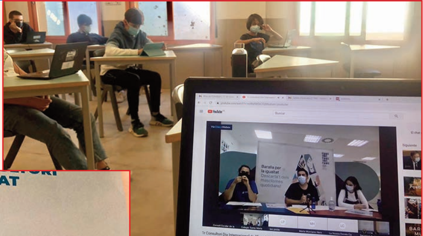
Cartell i activitats realitzades per commemorat el Dia dels Estudiants.

Els morts i deportats als camps de concentració van inspirar l'estudiantat del planeta la commemoració d'aquest dia per solidaritat de la lluita