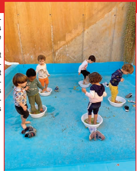
Alumnat d'Infantil 1, 2 i 3 Anys jugant amb la carabassa i xafant raïm.

El que sí suponem, tant en una com en l'altra activitat, és el plaer sentit pels infants per l'experimentació amb elements naturals i el contacte directe amb aquestes fruites de l'estació.