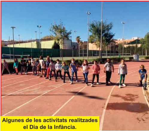
Algunes de les activitats realitzades el Dia de la Infància.

Picassent celebrà un any més, i amb totes les mesures de seguretat davant la Covid19, el Dia de la Infància.