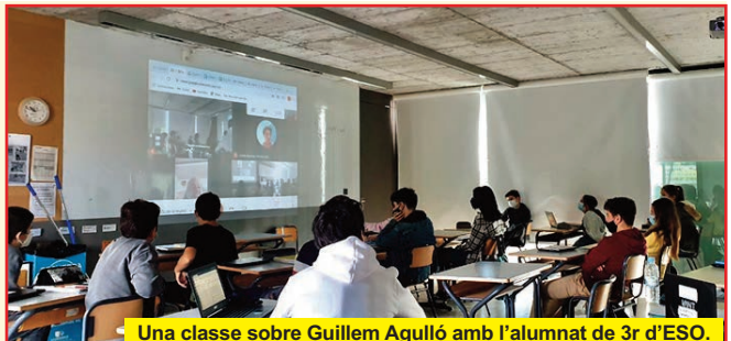
Una classe sobre Guillem Agulló amb l'alumnat de 3r d'ESO.

Ai, Guillem/ l'Imperi Romà/ va programar qual plor/ la data de la teua mort/ doncs/ tu vas morir/ vull dir/ t'assassinaren de forma vil/ l'11 d'abril/ del 1993 desencís/ i el dia 6/ encara encís/ era la lluna plena d'abril,/ i va ser Constantí el Gran,/ aquell emperador total/ qui a l'any 325 vital/ al concili de Nicea acordà/ que el diumenge de Pasqua/