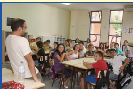
Acabem el curs amb unes fotos del seu inici.