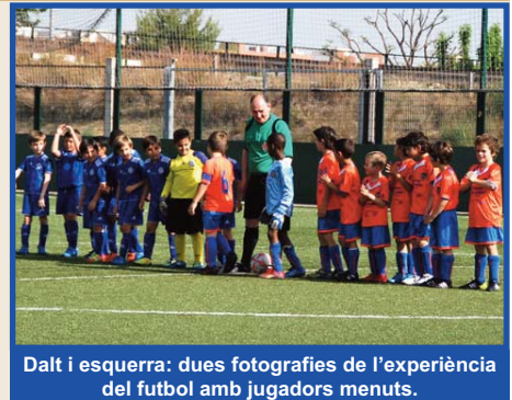
Dalt i esquerra: dues fotografies de l'experiència del futbol amb jugadors menuts.