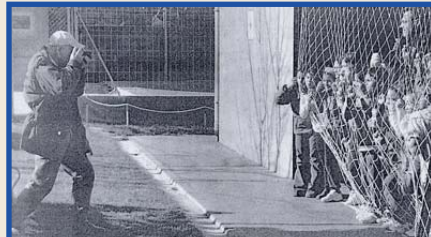
Sebastiao Salgado visità l'Escola i ens retratà.

La Trobada d'Escoles en Valencià es realitza a Alfafar