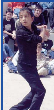
Balladora gitana actuant en maig de 2003.