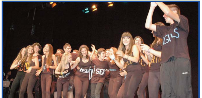
Dues fotografies de la representació de l'obra "Sóc persona" a Picassent.