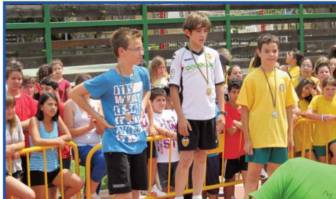
Fotos de la 30 Edició del Dia de l'Atletisme de les Escoles de Picassent.