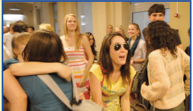
L'alumnat de 4t de Secundària està d'intercanvi lingüístic a Lituània.