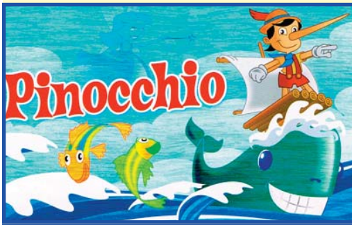
Cartell de l'obra teatral Pinocchio.

Passat divendres 11 de maig les classes de 1r, 2n 3r i 4t de Primària vàrem anar a veure una obra de teatre en anglés, Pinocchio. Com tots coneixem la història va ser més fàcil d'entendre. Hi participaren 3 dels nostres companys i passàrem un matí bastant entretingut.