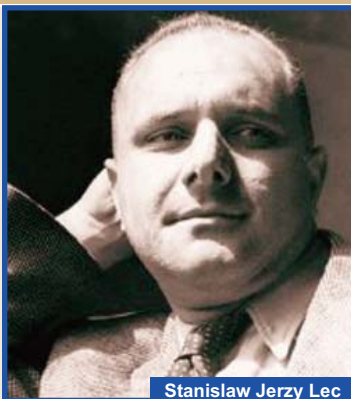
Stanislaw Jerzy Lec

Stanislaw Jerzy Lec (Lviv, Ucraïna, 1906 - Varsòvia, Polònia, 1966), escriptor polonès.