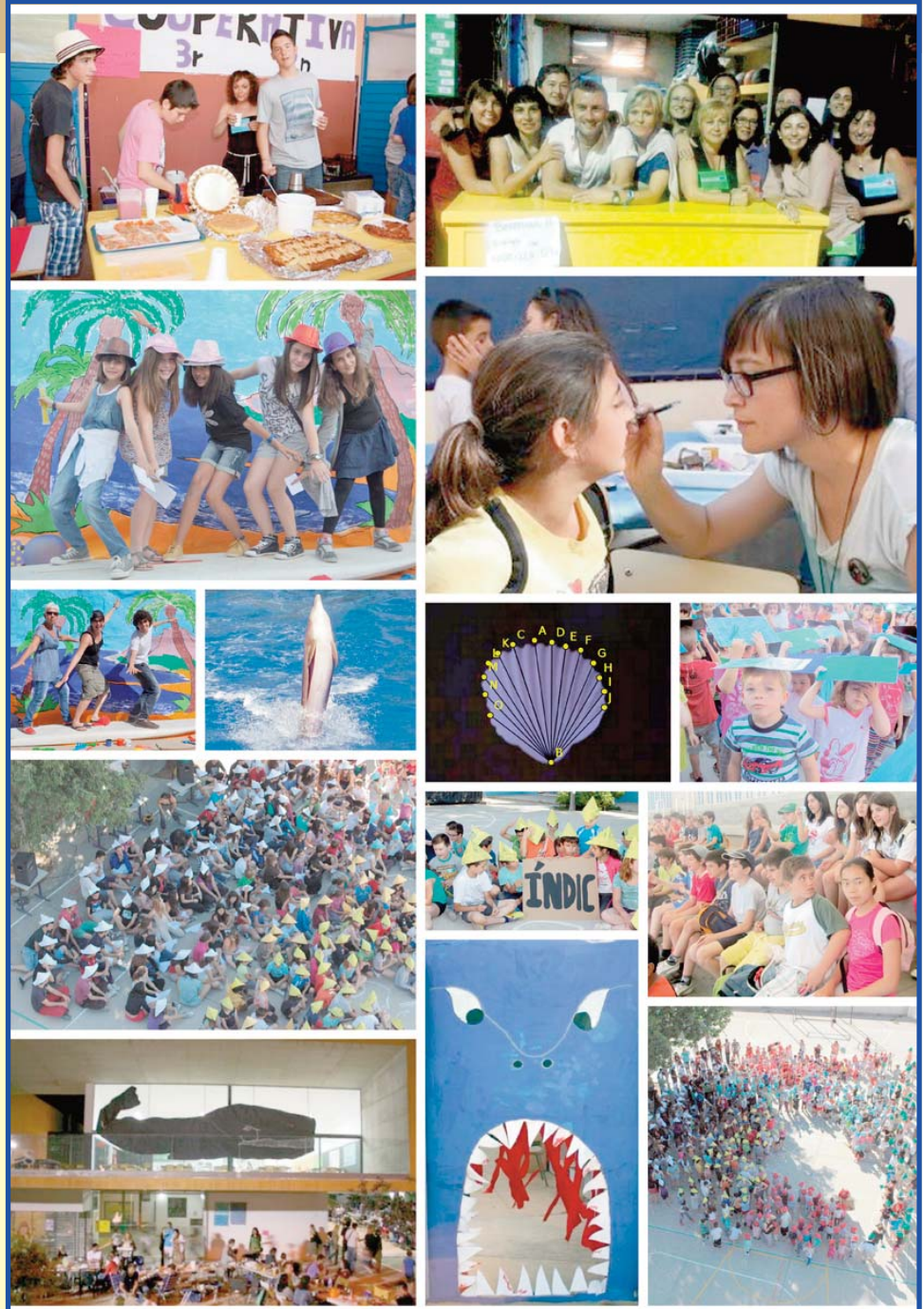
Mosaic de fotografies de la Setmana i de la Festa de la Primavera elaborat per Abelard Barberà.

Recordeu que demà dia 1 comença l'horari reduït: l'eixida serà a les 14:50 i l'autobús arribarà a les parades 1h i 45 minuts abans.