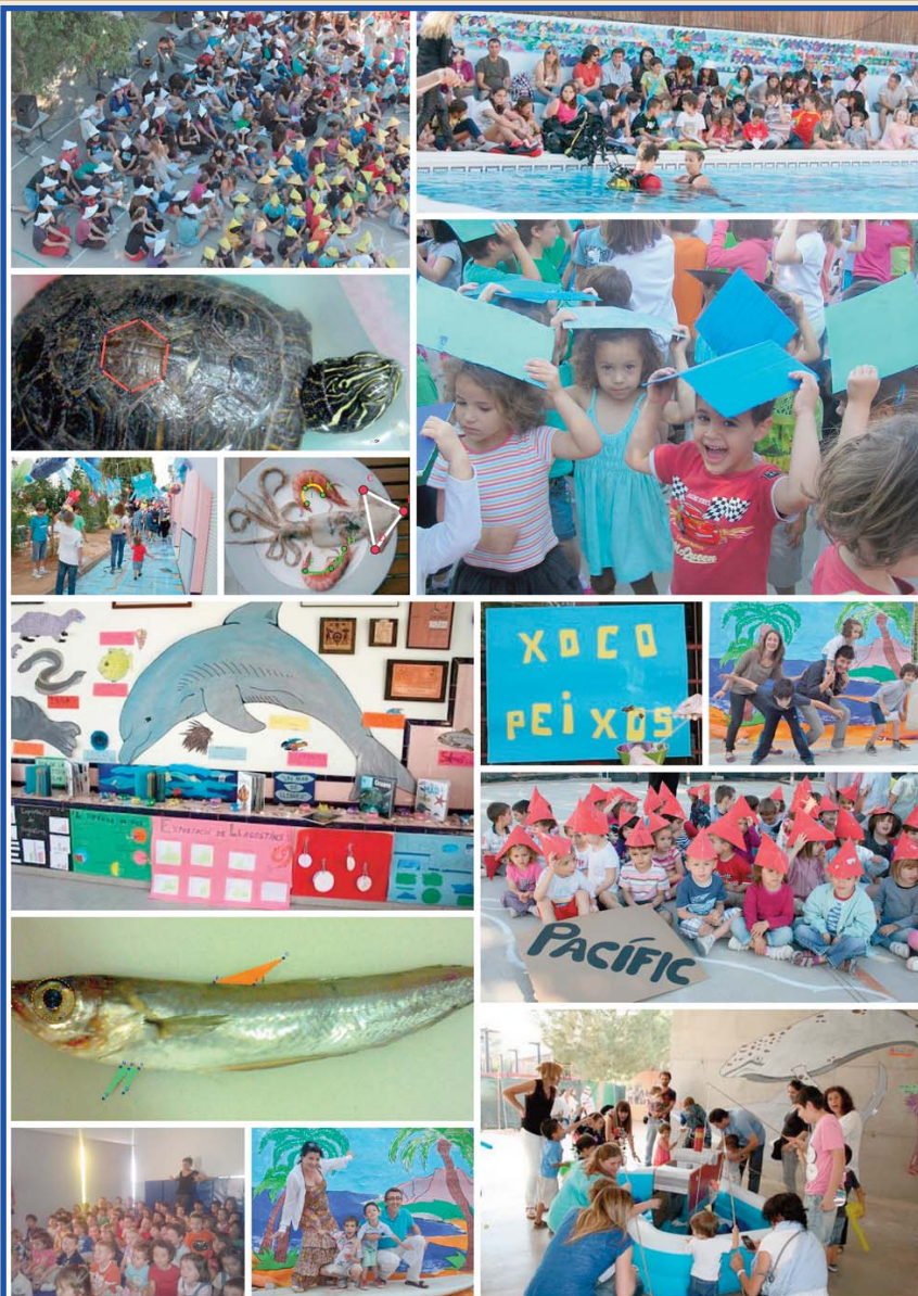
Segon mosaic de fotografies de la Setmana i de la Festa de la Primavera elaborat per Abelard Barberà.