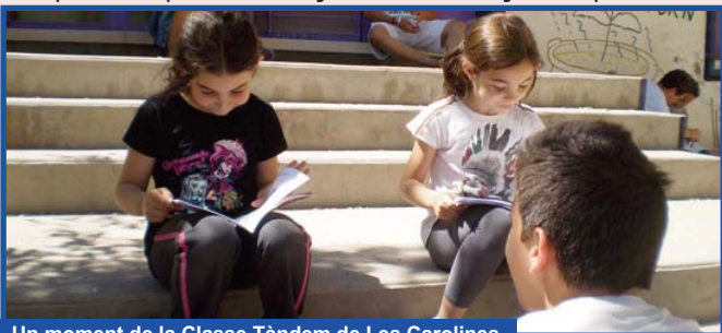
Un moment de la Classe Tàndem de Les Carolines.

Durant les últimes setmanes, les classes del primer cicle de Primària hem fet de mestres dels nostres companys/companyes de Tàndem. Els hem contat les històries que hem treballat a la classe d'anglès. Hem passat vergonya, al principi, però amb la seua ajuda i paciència ens ha eixit molt bé. Ha sigut una experiència positiva per a tots i ja estem desitjant repetir-la.