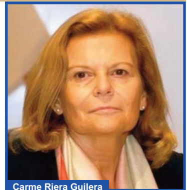
Carme Riera Guilera

Autora: Carme Riera Guilera (Ciutat, Mallorca 1948) és catedràtica de literatura espanyola i escriptora en llengua catalana. Va ser escollida membre de la Real Academia Española a l'abril de 2012.