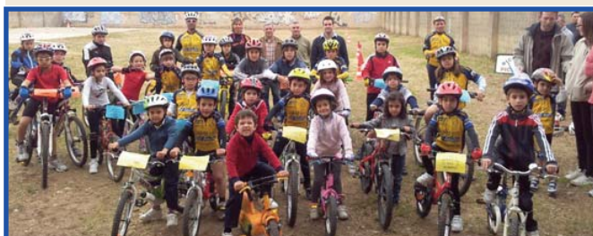
Integrants del Club Ciclista de Picassent practicant BTT al poliesportiu.

A gaudir de la bici i de les instal·lacions!