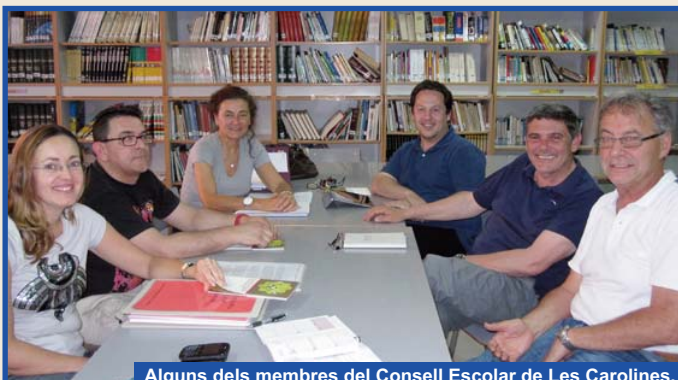
Alguns dels membres del Consell Escolar de Les Carolines.