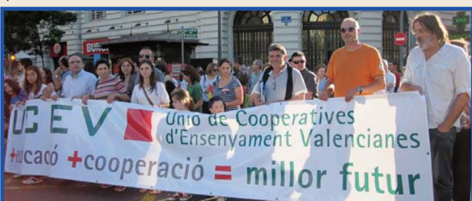
Pancarta d'UCEV en la manifestació del dimarts 22 de maig a València.

Passat dimarts el dia escolar va començar a les escales del Pati Central amb 145 alumnes de tots els cursos dels 500 matriculats. Vam distribuir-los per etapes. Tres professores d'Infantil i 4 auxiliars van atendre l'alumnat d'Infantil. Tres professores més l'alumnat de Primària i 2 el de l'ESO.