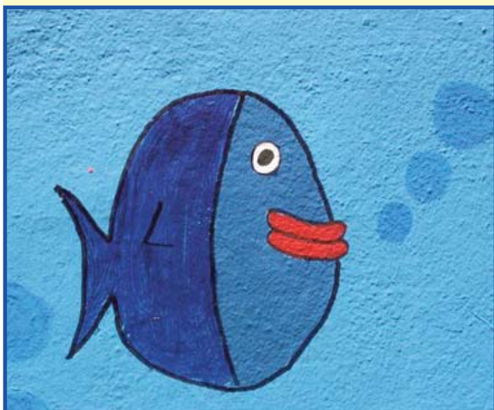
Detall del mural pintat a l'entrada de l'Escola per la Setmana de la Primavera.

Enhorabona a l'autor i a tots i totes les participants!