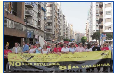
Capçalera de la cercavila de la Trobada a València.