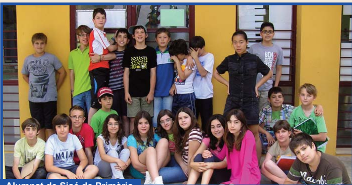
Alumnat de Sisé de Primària.

El procés de composició ha durat varies sessions. Hem llegit textos de García Lorca i Manuel Vicent. Hem vist el power point "Sorrilla y la luz" amb la cançó de "Mediterraneo" de Serrat de fons. Han planificat el treball fent-se guions, buscant adjectius que podríem aplicar al tema... i al final han sorgit textos amb molta tendresa, imaginació i molt personals.