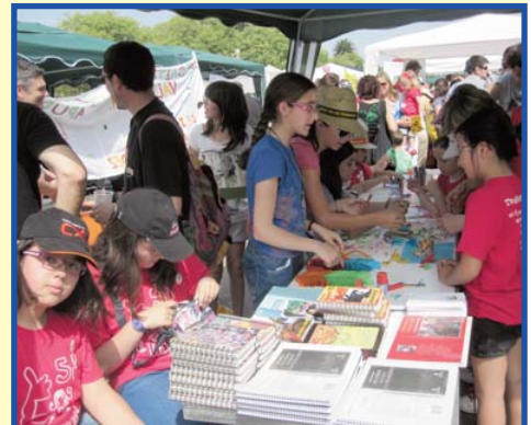
Paradeta de Les Carolines a la Trobada.