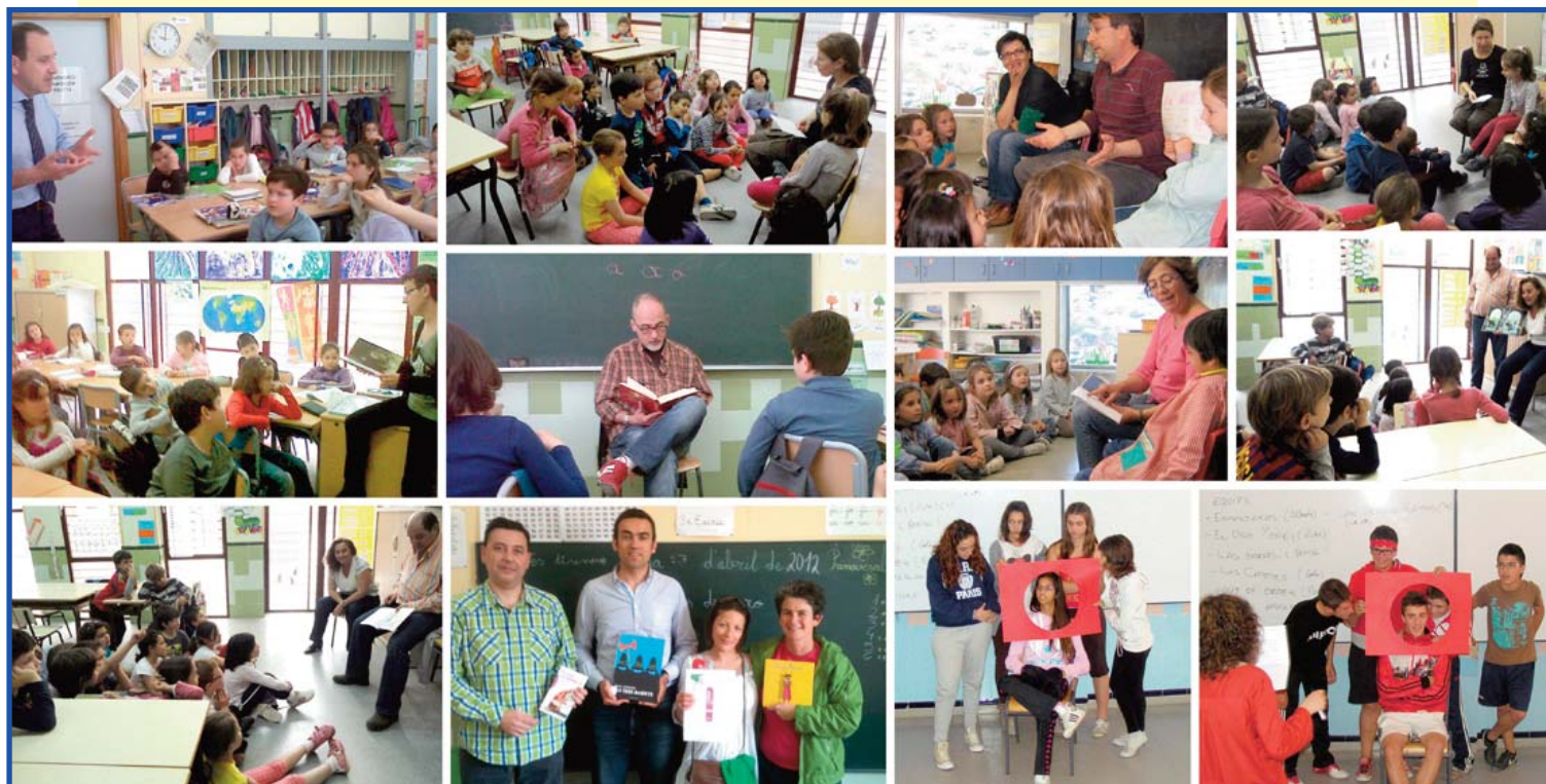
Diverses fotografies de les activitats realitzades al voltant del Dia del Llibre.

la panxa, de Tortugues i gelats, de Poemes (moltes voltes), de 3 bandits, de Petites massais, de Pinyols, de més Poemes, de Lobitos buenos y príncipes malos , de Prínceps transformats en lleons, d'Ous durs, de Plats de fusta i d'Històries d'avis i àvies.