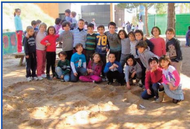
Els i les Selenites davant del poblat d'arena realitzat al pati de l'Escola.

Els i les Selenites de la classe de 2n B de Primària.