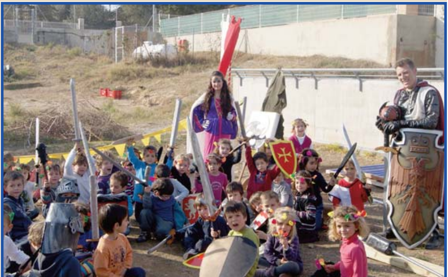
Dalt i baix tres fotografies del torneig realitzat per les classes d'Infantil 4 Anys A i B.