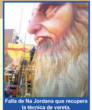
Falla de Na Jordana que recupera la tècnica de vareta.

(El dinar de demà serà diferent al que teniu al menú. Infantil i Primària: Pasta amb tomaca. Postres: gelat. Secundària dinarà les seues pròpies paelles i gelat de postres. Berenar: xocolata i bunyols per tot l'alumnat)