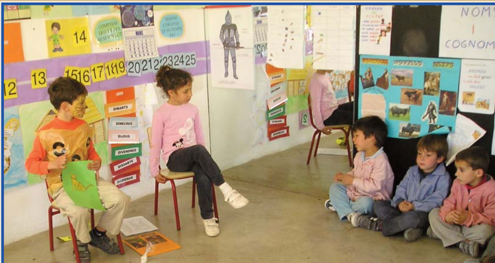
Alumnat de 2n A de Primària, expert en animals, explicant els seus coneixements a la classe d'Infantil 4 Anys A.

Després de demostrar a la classe que realment s'havien fet uns grans experts del seu animal, alguns d'ells i elles van decidir anar a unes altres classes de l'Escola a