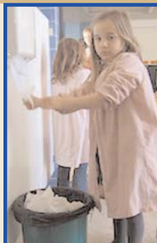
El bany d'Infantil 5 Anys ben net gràcies a totes i tots.

Dit i fet, una Marinera i un Mariner s'han ofert voluntaris per fer les fletxes, unes Submarinistes han fet els cartells i tots i totes ens hem responsabilitzat de replegar tot el paper que hi ha per terra.