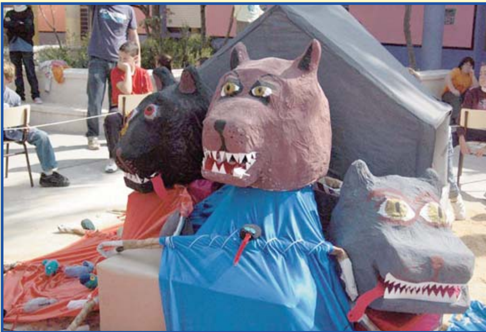
Falla escolar exposada al Pati Central de l'Escola el mes de març de 2008.