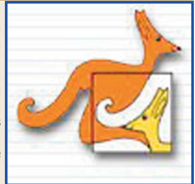
Anagrama de les proves matemàtiques.

Des de l'Escola pensarem en vosaltres. Moltíssima sort!