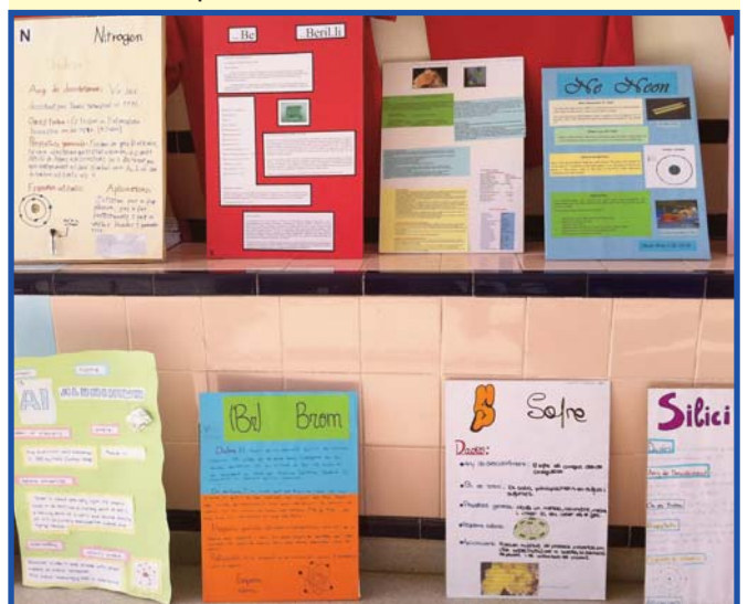
Exposició de treballs sobre la Taula Periòdica de l'alumnat de 3r d'ESO.

L'alumnat de 3r d'ESO ha presentat al rebedor de l'Escola l'exposició "Els 26 primers elements de la taula" on cadascú/cadascuna ha treballat l'element de la famosa taula periòdica de Mendelejev que li correspon per nombre atòmic. Curiosos i curioses podeu passar a indagar els misteris dels elements exposats: on i qui els descobrí? On es troben a la natura? Com són els seus àtoms per dins? Animeu-vos! Eureka!