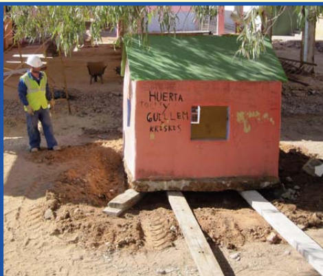
Moment del trasllat de La Caseta.

Quinze anys tenia "La Caseta" que en commemoració de les obres que l'Escola hagué de fer l'any 1997 vam construir al pati que duia el seu nom. Alguns pares/mares i alumnes varen contribuir a la seua construcció en la Festa de la Primavera dedicada a l'Arquitectura i posteriorment moltes promocions d'alumnes han jugat entre les seues parets i al seu voltant. Tanta importància va tenir a la vida dels més menuts i menudes que quan vam conèixer que en començar les actuals obres "La Caseta" hauria de ser enderrocada tot un moviment popular d'alumnes de l'Escola va manifestar-se en contra de la seua destrucció. Cartes, dibuixos, pintades, llàgrimes, descripcions i