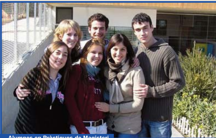
Alumnes en Pràctiques de Magisteri.