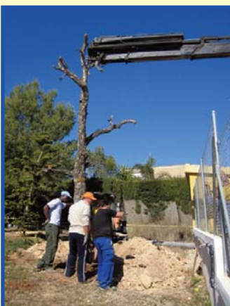
A l'esquerra moment en el que es trasplantava la surera. Al centre el roure i a la dreta la prunera en la seua nova casa.

Les obres per a les noves instal·lacions de Secundària, administració i laboratoris han motivat l'extracció d'una quantitat important