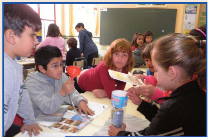
Alumnat de 3r de Primària fent màquines senzilles.

OBRIM tots els matins, totes les vesprades i tots els dissabtes.