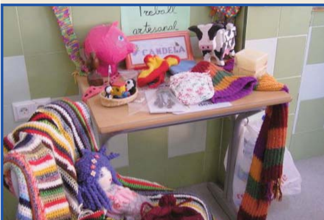
Exposició de productes artesanals realitzada per l'alumnat de 3r de Primària.

cases. N'hi ha de tot: bufandes, barrets, ninots, llibretes, màscares, mantes, objectes de decoració ... gràcies a les nostres famílies per tanta col·laboració! Per concloure el tema, també estem fent un experiment per tal de construir-ne una, es tracta d'un elevador. Ha estat d'allò més divertit!!!