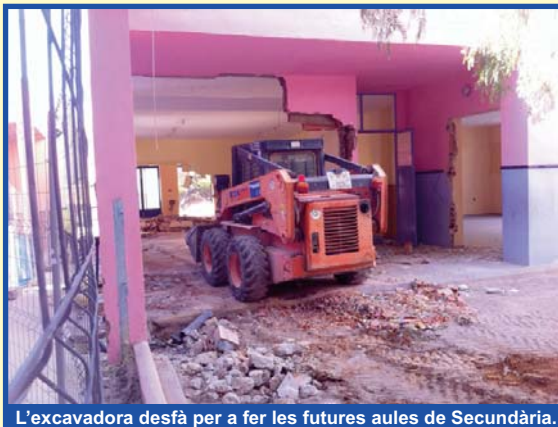
L'excavadora desfà per a fer les futures aules de Secundària.

qüestió de poc de temps, serà el símbol d'un futur, ple de passat i de somnis.