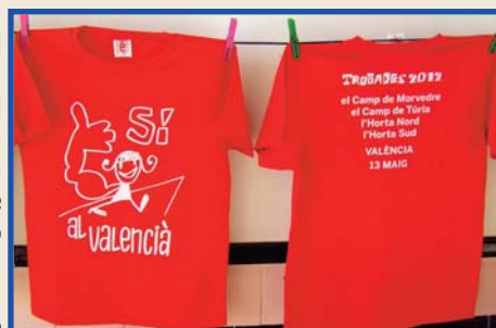
Samarretes de la Trobada 2012.