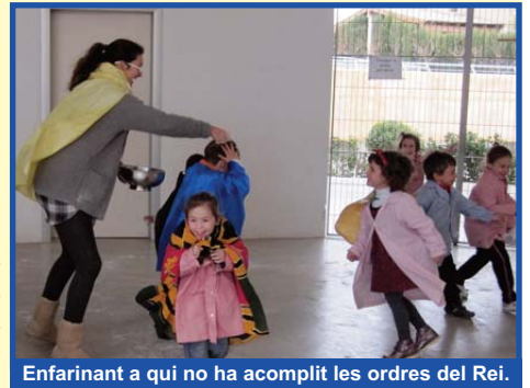
Enfarinant a qui no ha acomplert les ordres del Rei.

Anem vestits de diferents maneres: tots igual i també tots diferents.