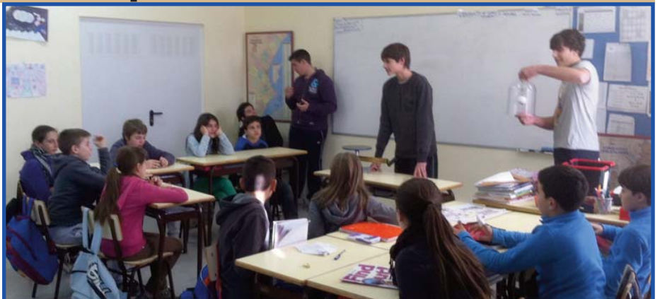
Alumnat de 4t de Secundària explica experiències de Física a companys i companyes de 5é de Primària.