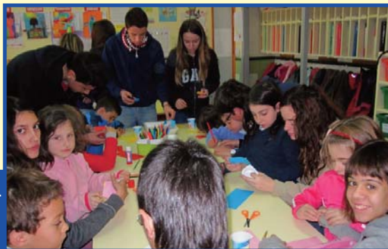
Activitat Tàndem de l'alumnat de 3r d'ESO i 1r de Primària B.

Fins la propera companys i companyes tàndem!!!!