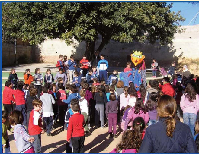
Alumnat de Primària amb el Rei de Carnestoltes.

Diuen que és una festa pagana, no religiosa. Però també la seua existència està vinculada a la religió cristiana. En un temps on la repressió era brutal la celebració de Carnestoltes permetia un esclat de llibertat i festa no permesa la resta de l'any i que conclouia en començar la Quaresma. Temps era temps.