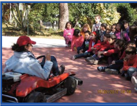
Un dia especial al Parc de Trànsit de Gilet.

El circuit i els seus voltants semblaven llocs molt bonics,