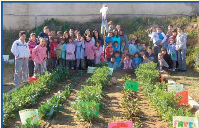
Activitat Tàndem de l'alumnat de 6é de Primària i Infantil 5 Anys A

Passat dijous 9 de febrer les classes de 6é de Primària i 5 Anys A -Submarinistes-, més les classes de 1r B de Primària -Maquinistes- i 3r d'ESO vam trobar-nos una vegada més per realitzar una activitat tàndem.