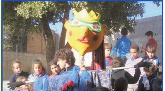
Detall del Rei de Carnestoltes amb alumnat i professorat.

Nosaltres no som una excepció i a l'Escola Les Carolines el Carnestoltes l'hem celebrat sempre. I aquest curs, també. No és el de Río, ple de ballarines i ballarins a ritme de samba; ni el de Venècia, ple de màscares i capes ele-