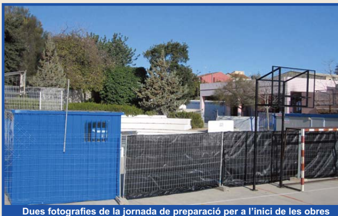
Dues fotografies de la jornada de preparació per a l'inici de les obres