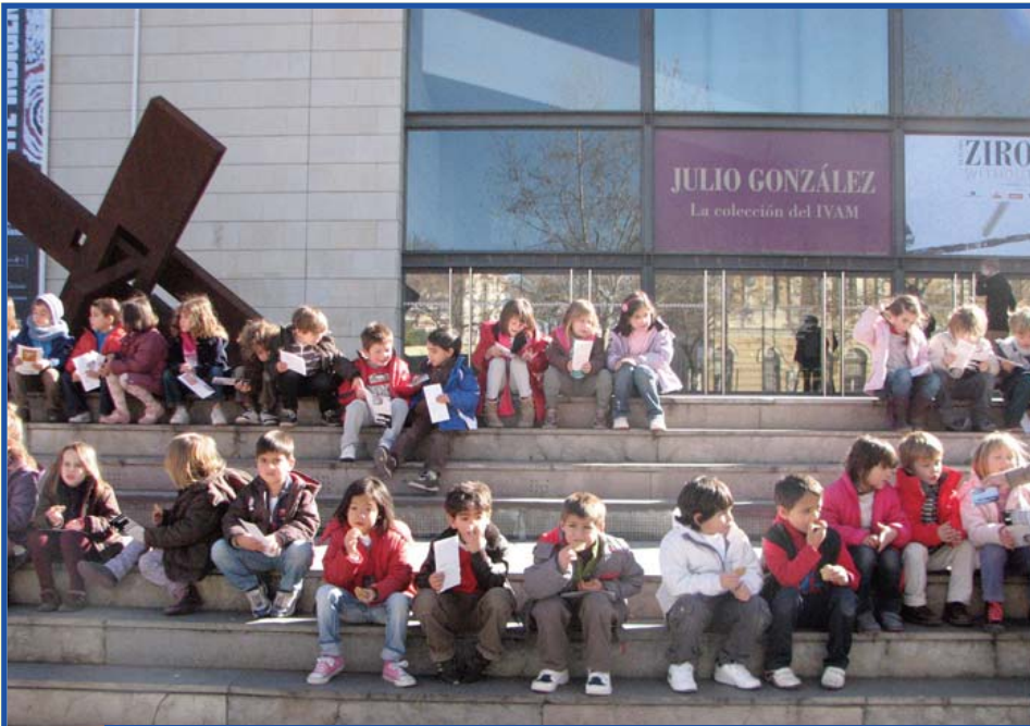
Alumnat d'Infantil 5 Anys de Les Carolines a la porta de l'Institut Valencià d'Art Modern -IVAM-.