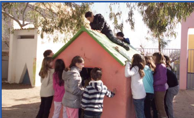
Alumnat de Primària pintant frases d'acomiadament sobre la caseta.

Divendres passat ens alçarem del llit amb fred i amb una mica de tristesa. De bon matí ja teníem ganes d'anar-hi, de veure-la i gaudir-la per última vegada. I és que sabem que era la nostra darrera oportunitat d'estar en eix lloc tan especial per a molts/moltes de nosaltres, el Pla de la Caseta, a l'antic pati d'Infantil i actualment de Primària.