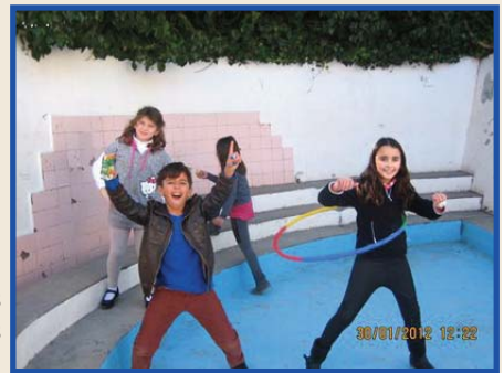
Alumnat de Primària en la piscineta.

Rialles, fotos, signatures i records digueren adéu a aquest espai emblemàtic de la nostra Escola.