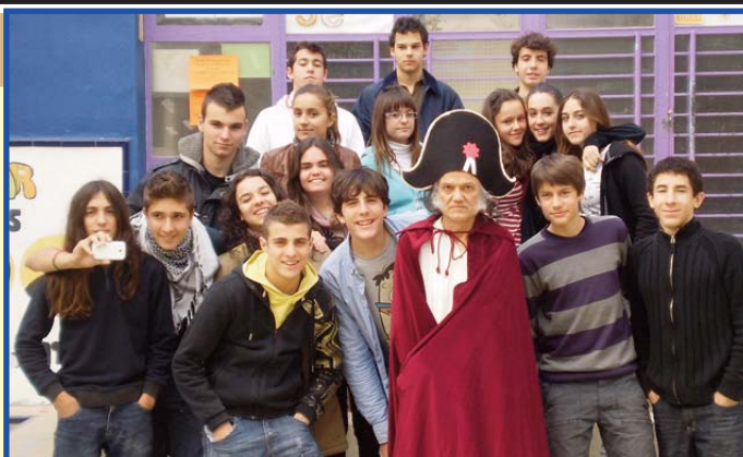
Alumnat de 4t de Secundària amb el personatge històric, Napoleó.

En una ocasió contà una matança que va dirigir a la ciutat francesa de Toló on hi havia uns 800 sublevats. Se'n reia de com els matava. Potser la imatge que ha conservat Napoleó al llarg dels dos últims segles és massa idíl·lica i benèvola però en realitat les seues estratègies i actituds s'apropen a les tècniques hitlerianes. No cal oblidar que Hitler admirava molt Napoleó i es va llegir les seues batalles. El 22 de juny del 2012 (exactament el dia que acaba el present curs escolar) farà 200 anys del moment en què Napoleó -aprofitant l'inici del