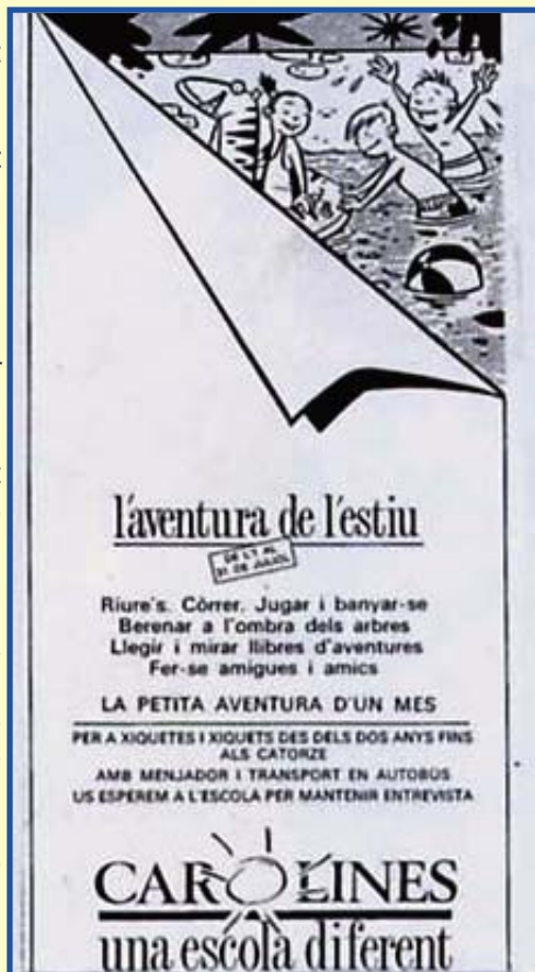
Publicitat de l'Escola d'Estiu de Les Carolines publicada al semanari "El Temps" l'any 1988.