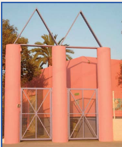
Porta de Les Carolines construïda l'any 1982

La cantant i bailaora Lola Flores és culpable d'un delictes de frau fiscal per un import de 48 milions de pesetes. Va demanar una pesseta a cada espanyol.