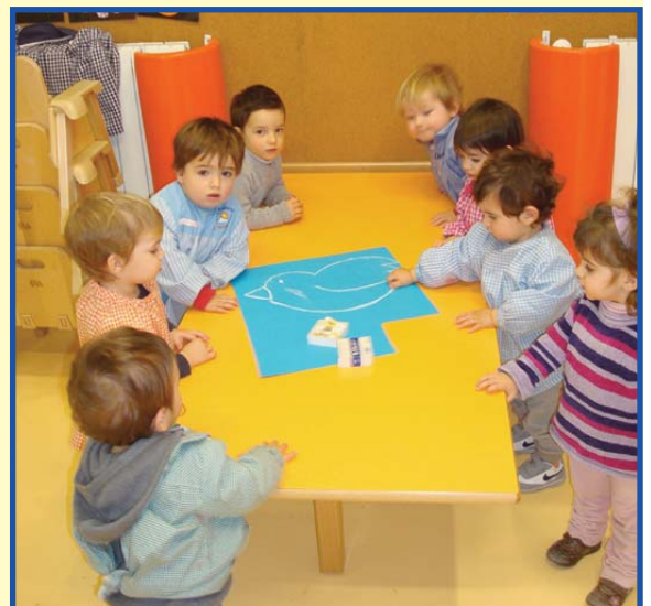
Esquerra i dalt dues fotos de l'alumnat d'infantil 1 Any pintant un mural sobre el dia de La Pau.

asun roca técnico superior dietética y nutrición 639 35 23 52 asunroc@hotmail.com salud 100%