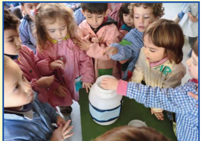
Alumnat de Segon Cicle d'Infantil dipositant monedes en la vidriola.

nalment a aquell país i en la mateixa selva. Va col·laborar, de manera excel·lent, l'alumnat de 3r i 4t de Primària amb la interpretació del poema La pau amarga de Marc Granell. Seguidament, tots i totes van dipositar les monedes a la vidriola.