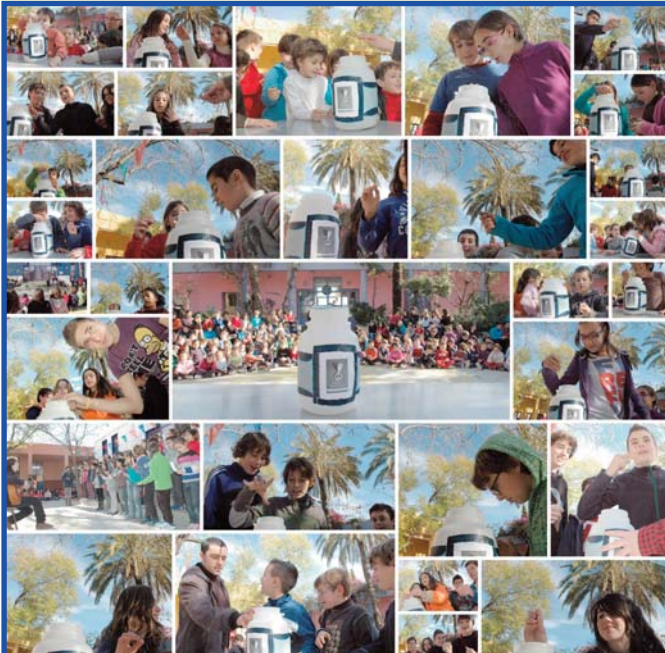
Collage fotogràfic de les activitats realitzades en Primària i Secundària.

A tots els indrets on hi ha escoles -que no són tots ni molt menys- es va celebrar dilluns passat l'aniversari de Gandhi convertint la jornada en el dia escolar per la pau i la no violència.