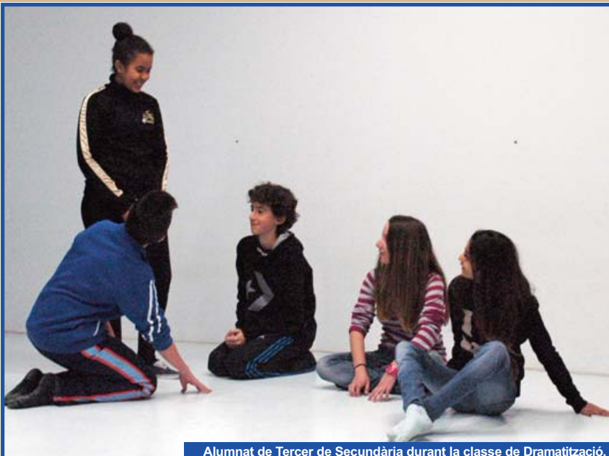
Alumnat de Tercer de Secundària durant la classe de Dramatització.

Encara ens queda per a l'estrena però, malgrat tot, tre-