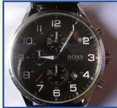
A les 9:05 obrim l'Escola. Puntualitat!!