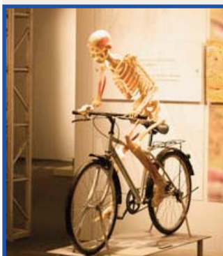
Dues imatges de l'exposició

Va ser a Paterna, al complex d'oci Heron City, lloc que alberga la polèmica exposició científica Bodies Revealed que ha recorregut ja mig món i, a hores d'ara, es troba al nostre territori.