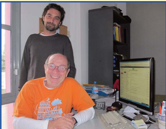
Sergi i Abelard són els responsables de la Secretaria de Les Carolines.

Hi ha una part de l'Escola que quasi no es veu perquè està guardada als ordinadors i als armaris, però que tard o d'hora tots i totes necessitem. De confeccionar i guardar tota la documentació admi-