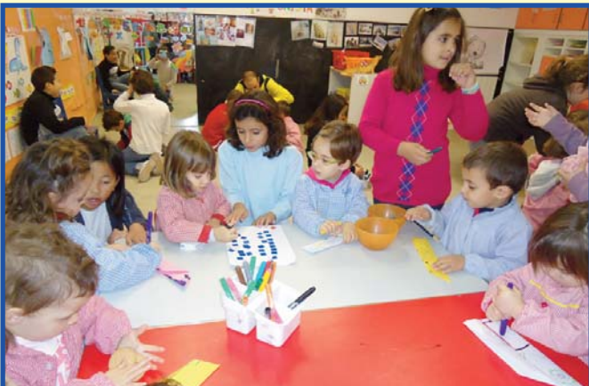
Alumnat de 3r A de Primària fents avions amb l'alumnat d'Infantil 3 Anys.

Encara que va ocórrer l'any passat no volíem deixar passar l'oportunitat de contar-vos el nostre Tàndem. Va ser 14 de desembre de 2011 quan Exploradors i Exploradores ensenyàrem a construir avions als i les Inuits, donat que els nostres companys menuts i menudes estaven treballant el projecte de l'aviació.