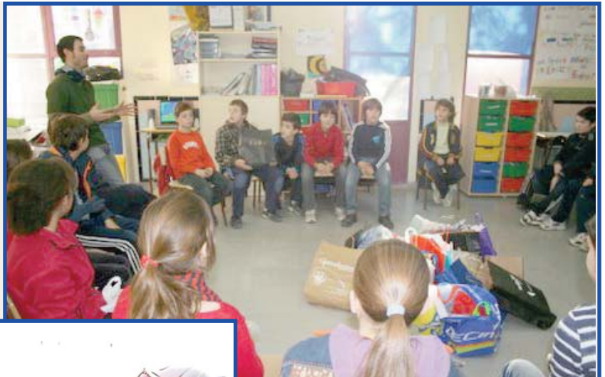
Moment de l'Amic Invisible a de Tercer de Primària.