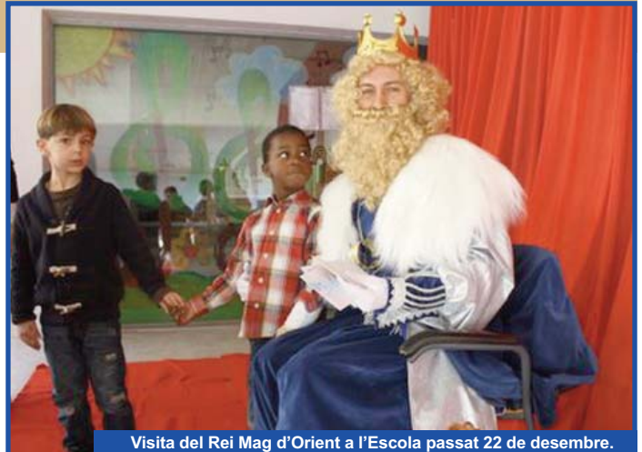
Visita del Rei Mag d'Orient a l'Escola passat 22 de desembre.