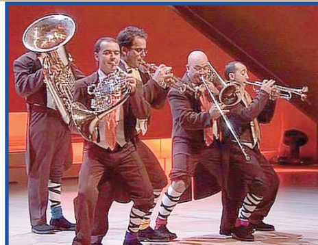
Grup Instrumental Spanish Luur Metals.

Esperarem a que tornen per preguntar-los si els ha agradat, però n'estem segurs que algun que altre talent musical s'ha despertat aquest matí.