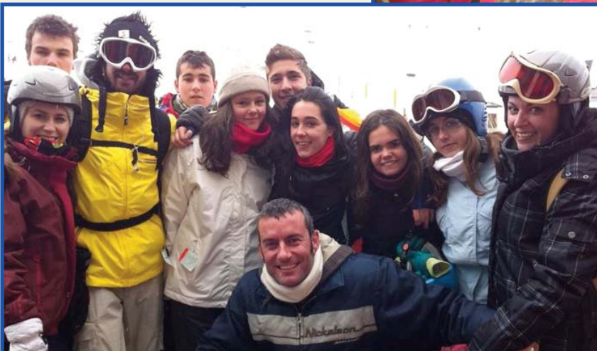
Alumnat i professorat de Secundària en les pistes de Boí-Taüll el passat mes de desembre.