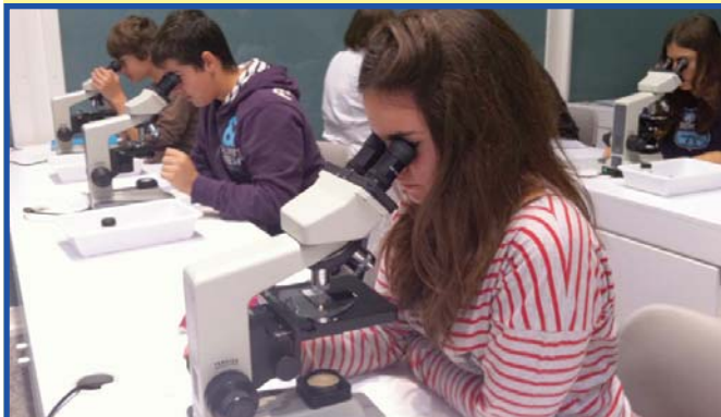
Alumnat de 4t de Secundària fent pràctiques amb microscopis.

L'alumnat que cursa Biologia i Física de 4t d'ESO visita passat divendres el Museu de la Ciència de la Ciutat de les Ciències per fer diverses activitats