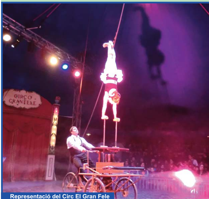
Representació del Circ El Gran Fele

Dilluns dia 11, van anar al circ els i les 150 alumnes del 2n cicle d'Infantil (3, 4 i 5 anys). L'espectacle que vam triar per a la visita s'anomena Un pessic de sal i està dirigit pel Gran Fele. Van gaudir del funambulisme, d'un pallasso amb una capsa de la qual eixia un gos que no era un gos... de la màgia de l'espectacle més gran del món.