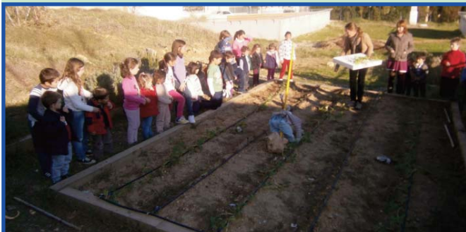
Fotografia del Tàndem Infantil 3 B i 3r de Primària B, en l'hort escolar.