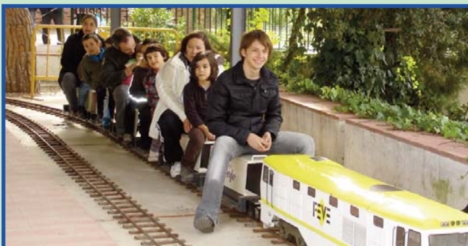
Passeig amb el tren miniatura pel Parc Municipipl de Riba-roja de Túria.

Us adjuntem la carta que ens envien les famílies dels/de les Ciclistes per contar-nos una aventura dominical. Gràcies per fer-ho.