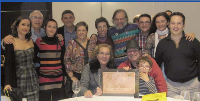
Assistents de Les Carolines al Sopar de Tardor amb la placa entregada a l'Escola per ser una de les primeres en fer l'ensenyament en valencià.