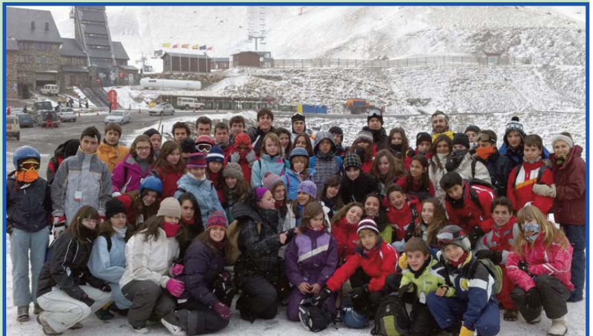
Alumnat de Secundària en les pistes de Boí-Taüll durant el viatge a la neu 2011.

Dimecres no vam poder esquiar a causa de la perillositat de la força del vent i avui dijous després de les classes