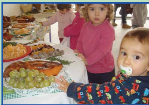
Alumnat contemplant els fruits de la tardor.