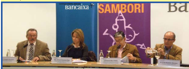
Presidència dels Premis Sambori 2011.