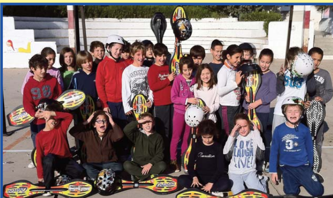
Dues fotografies de l'alumnat de Primària practicant Street surfing.

Durant la setmana del 21 al 25 de novembre, els cursos de 3r A, 3r B, 4t, 5é, 6é de Primària i 1r, 2n 3r i 4t d'ESO hem gaudit a les classes d'Educació Física del Street Surfing, una nova modalitat de monopati.