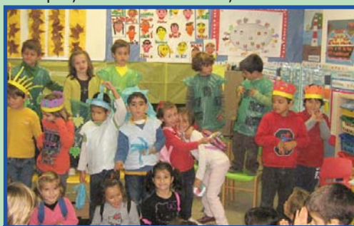
El teatre també és part de la Festa de La Castanyada.

Pel matí, l'alumnat d'Infantil 5 anys ens va delectar amb sengles obres de teatre: La fada Filomena i El pardalet de l'ala trençada. Tot un èxit.