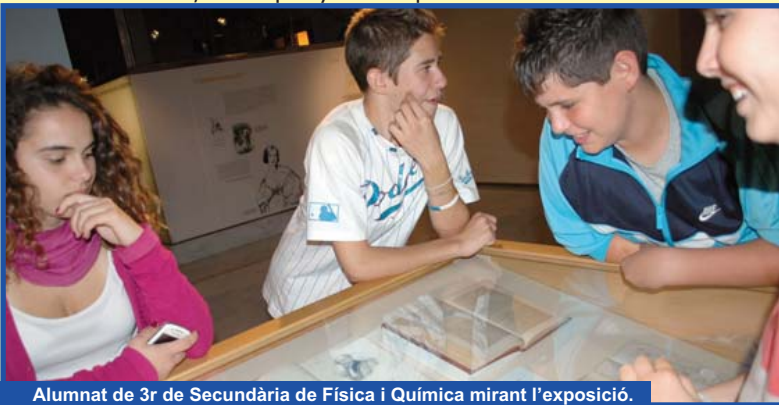
Alumnat de 3r de Secundària de Física i Química mirant l'exposició.