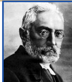
Miguel de Unamuno

Miguel de Unamuno y Jugo (1864-1936), escriptor i filòsof espanyol.