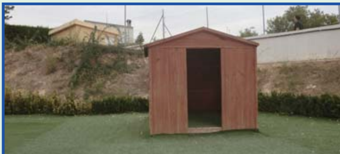
I ara podem jugar al pati d'Infantil sense embrutar-nos de pols i pedretes.

Ja han passat uns dies d'això i ara continuem igual: és el lloc que ens hem reservat per mantenir-lo net, net, net. Ens agrada veure'ns-lo així, acurat.