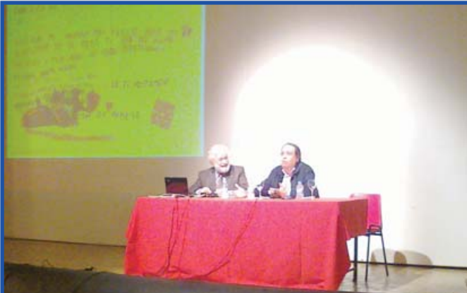
Moment de l'exposició de Francesco Tonucci passat dissabte 22.

- Continua escrivint-me perquè jo et contestaré encantada.