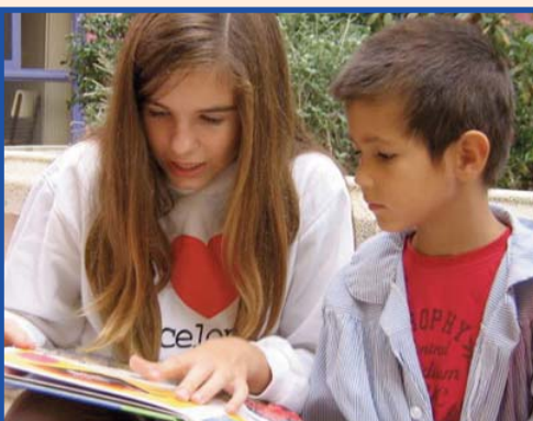
Tres fotografies de l'activitat "Un mar de llibres".