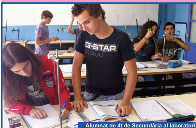
Alumnat de 4t de Secundària al laboratori.