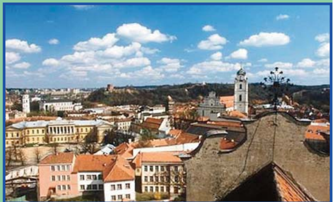
Panoràmica de Vilnius, capital de Lituània.