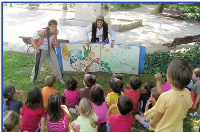
Pirates i Víkings al parc de Vivers escoltant una història i cercant un tresor.

Vam passar moltes proves i jocs per aconseguir-ho: un ocea de molts colors, un conte gegant del Capità Calabrota, un pirata/víking molt estrabul·lat al qual li havien apagat el llum, i un altre al qual li havien fet un encanteri i tenia el dit pegat a la boca. Al final, va aparèixer la filla del Capità Calabrota amb el cofre del tresor i ens van regalar un collar a cadascú.