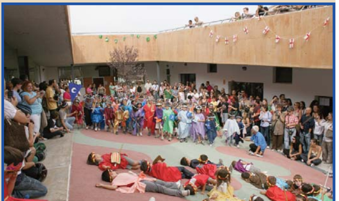
Batalla entre Moros i Cristians al pati d'Infantil realitzada el 7 d'octubre.

Massapà, massapà, més massapà. Té, polioli, suc de llima, sucre. Música, banderoles, crits, rialles. Pares, mares, iaies i germans. Dolça festa. Dolces gràcies per fer-la possible.