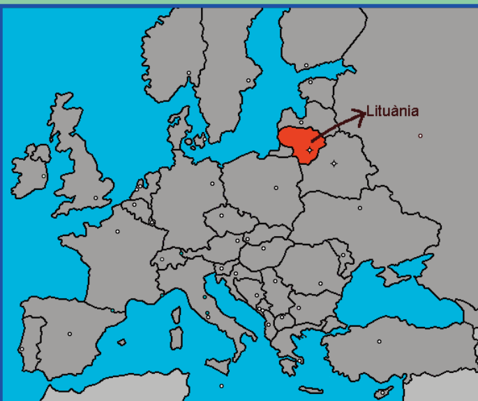
Mapa on podem localitzar Lituània dins la Unió Europea.

Lituània és un estat d'Europa, i el més al sud dels estats bàltics. Limita al nord amb Lètonia, a l'oest amb la mar Bàltica, al sud-est amb Bielorússia, i al sud amb Polònia i Kaliningrad (Rússia). Va formar part de la Unió Soviètica sota el nom de República Socialista Soviètica de Lituània. És membre de l'OTAN, del Consell d'Europa, i de la Unió Europea. La capital és Vilnius, Capital Europea de la Cultura al 2009.