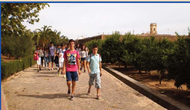
Alumnat de 3r i 4t de Secundària, dalt a Mascarell i baix a El Puig.

L'alumnat de Secundària es dividí en dos grups. 1r i 2n visitaren el Micalet, les torres dels Serrans i la plaça del poeta Llorente on es troba una placa explicativa que indica el lloc on es trobava la porta de Xadxa, per on entrà triomfalment Jaume I el 9 d'octubre del 1238.