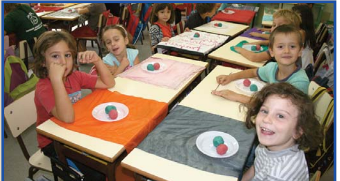
Dalt i baix fent figuretes de massapà per a la tradicional "mocadorà".

L'alumnat dels quatre cursos havia treballat en classe un dossier i havia fet unes activitats prèvies que després es completaven amb la visita i amb altres activitats in situ.