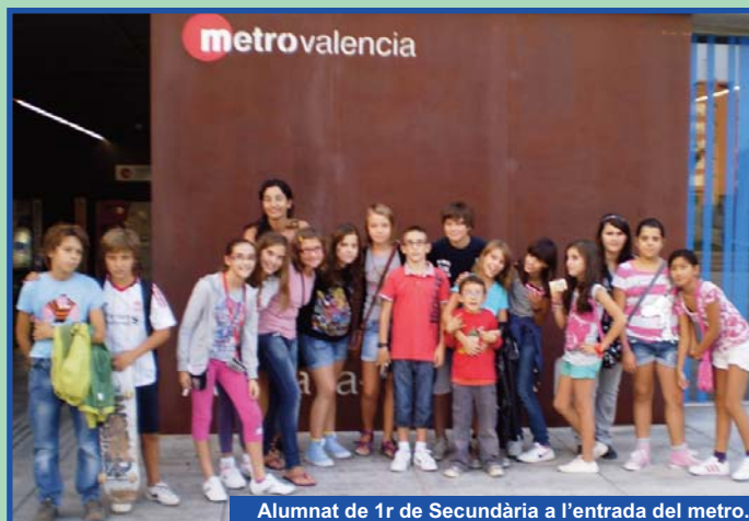
Alumnat de 1r de Secundària a l'entrada del metro.