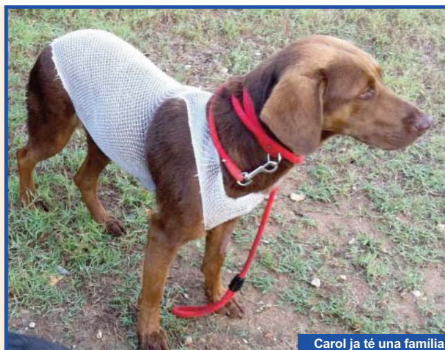
Carol ja té una família.