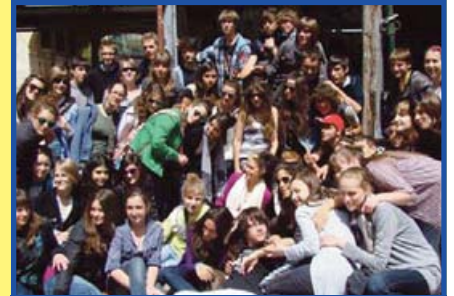
Tres fotos de l'intercanvi del passat curs 2010-2011 amb Polònia.

Els direm adéu, proper dia 21 d'octubre, amb l'esperança d'haver sigut bons i bones amfitrions i amb la seguretat de què se'n duran un bon record.