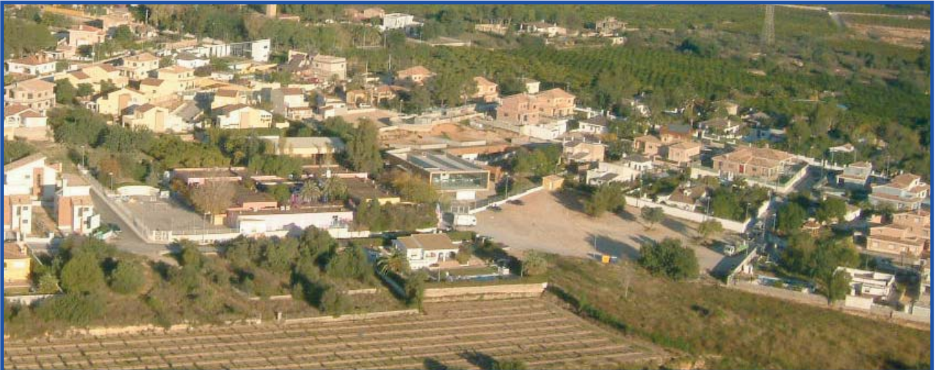
Dalt i baix dues panoràmiques aèries de l'Escola i de la Urbanització Lloma de la Verge.

Estem segurs/segures de la vostra col·laboració.